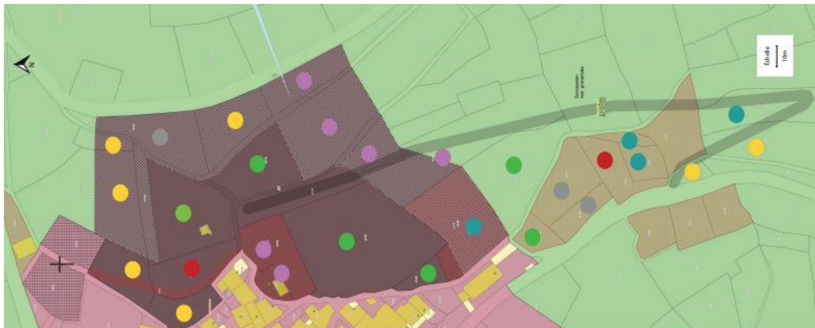
Carte du zonage du projet d'éco-hameau dans le centre bourg de Chirois 07380 (2021)